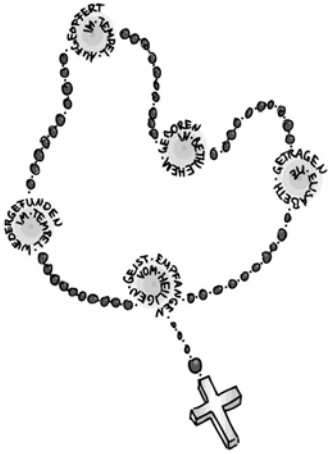
Grafik: Sarah Frank in: Pfarrbriefservice.de

Wir beten im Juli besonders für alle Familien, mit den Eltern und Kindern, und für alle anderen, die Urlaub und Ferien machen das Gesetz: