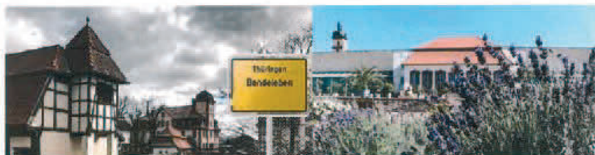
Barock-Dorf Bendeleben Orangerie & Schlosspark