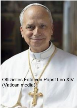
Offizielles Foto von Papst Leo XIV.

Sein Wahlspruch – ein Wort des heiligen Augustinus - lautet: „In illo uno unum“, übersetzt: