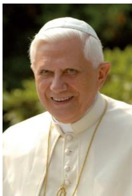
Offizielles Foto von Papst Benedikt XVI.

können Sie sich noch an ein konkretes Ereignis im September 2011 erinnern? Ich meine nicht der Terroranschlag auf das World Trade Center in New York. Das war nämlich bereits im Jahr 2001. Ich denke an den Besuch von Papst Benedikt XVI. in Deutschland und seinen Aufenthalt im Bistum Erfurt. Seine Reise stand unter dem Motto: